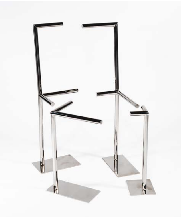
Arik Levy, Abstraction , 2010 Acier inoxydable, édition de 1/8 + 2 E.A. + 2 prototypes 86 × 40 × 48 cm Collection Thierry Barbier-Mueller