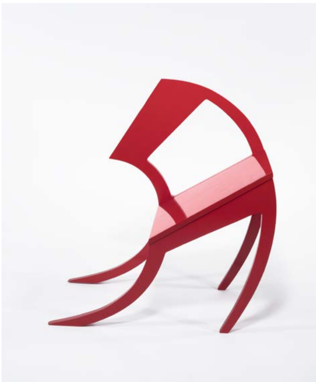
Stefan Wewerka, Klassenraum , 1971 Bois laqué rouge, édition 17/40, 70 x 68 x 40 cm Collection Thierry Barbier-Mueller

L'exposition A chair and you offre un aperçu de cet ensemble d'objets inédits représentatifs d'une histoire du design contemporain. Un catalogue d'environ 400 pages publié par Lars Mueller Publishers GmbH en octobre 2022 documente l'intégralité de cette collection de chaises.