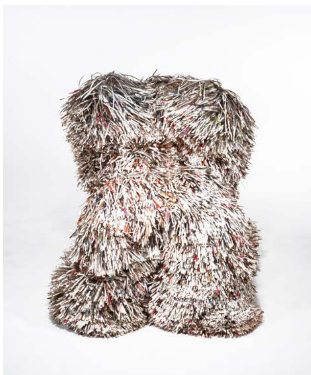
Charles Kaisin, Hairy Chair , 2011 Bois, colle, lamelles de papier, édition 8/20, 82 × 78 × 80 cm Collection Thierry Barbier-Mueller