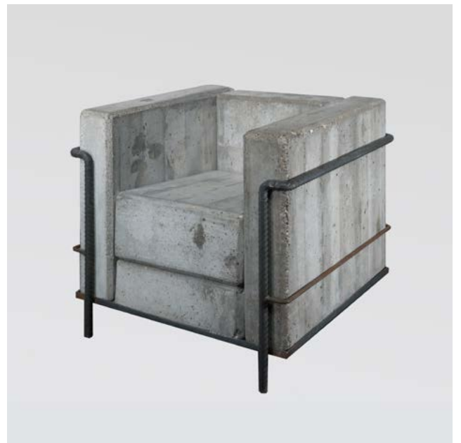
Stefan Zwicky, Grand Confort, Sans Confort, Dommage à Corbu , 1980 Béton et acier, édition 32/35, 67 × 75,5 × 70 cm Collection Thierry Barbier-Mueller