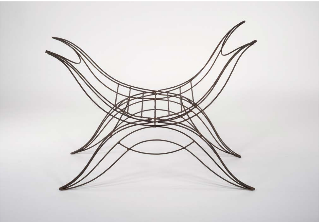
André Dubreuil, Tabouret , 1986 Fer forgé, pièce unique, 76 × 100 × 44 cm Collection Thierry Barbier-Mueller