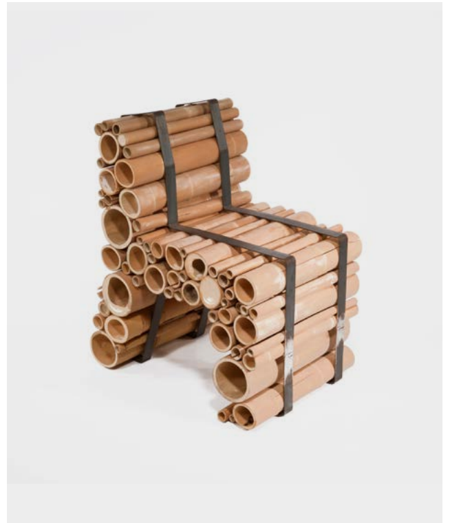
YKSI design, Bamboo Chair , 2007 Bambou acier, prototype 1/10, 85 × 52 × 70 cm Collection Thierry Barbier-Mueller