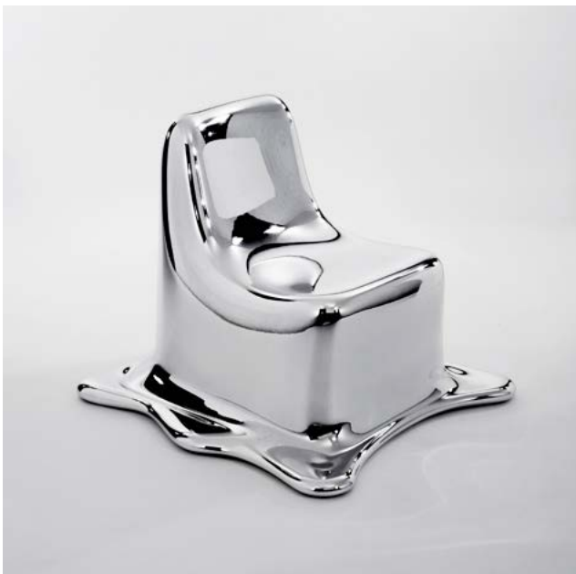
Philipp Aduatz, Melting Chair , 2011 Fibre de verre avec revêtement en argent Édition de 12 + 3 E.A., 81 × 93 × 99 cm Collection Thierry Barbier-Mueller