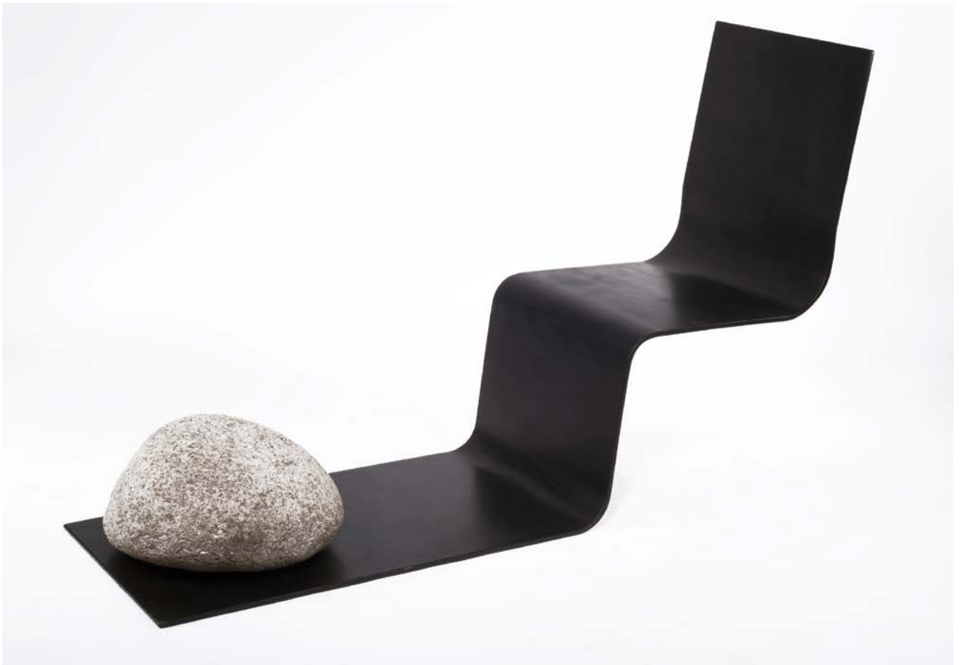
Choi Byung-Hoon, Afterimage 01-105 , 2001 Simili cuir noir, acier inoxydable, granit, pièce unique. 61 × 55 × 195 cm Collection Thierry Barbier-Mueller