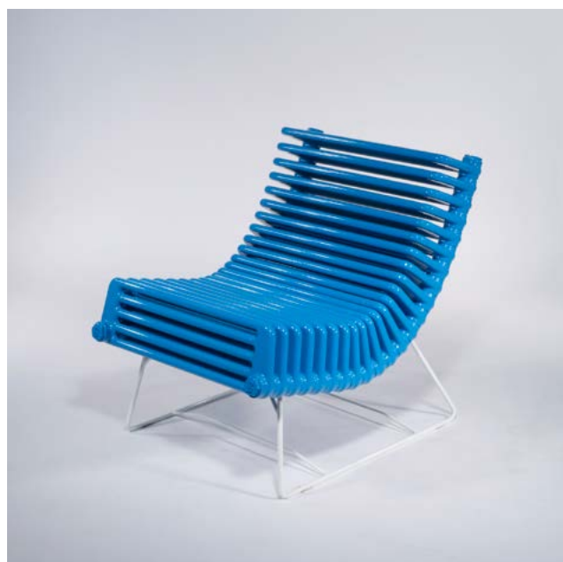
Boris Dennler, Siège radiateur , 2012 Radiateur et métal peint, plié à la main, Pièce unique, 77 × 60 × 80 cm Collection Thierry Barbier-Mueller