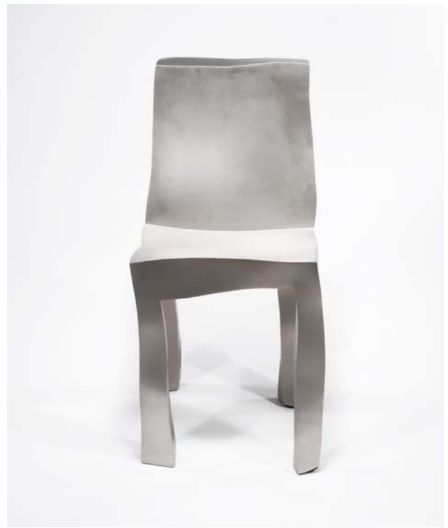
Maarten Baas, Sculpt Stainless Steel Dining Chair , 2007 Acier inoxydable sablé, édition 4/8 + 2 E.A., 84 x 40 x 43 cm Collection Thierry Barbier-Mueller