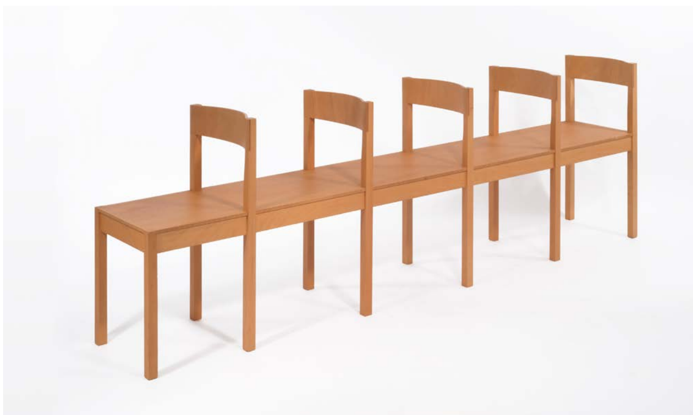
Couverture Dessin de Robert Wilson, A chair and you , 2021