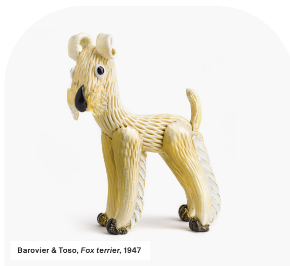
Barovier & Toso, Fox terrier , 1947