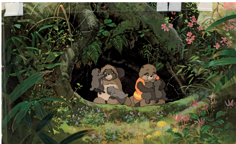
Pompoko © 1994 Isao Takahata/Studio Ghibli, NH

Après avoir quitté Tōei Animation, Takahata ouvre de nouveaux horizons avec plusieurs séries télévisées devenues des classiques : d'abord Heidi (1974), puis Marco (1976) et Anne... la maison aux pignons verts (1979). Malgré les contraintes de planning imposant de finaliser un épisode chaque semaine, l'équipe a déployé des trésors d'ingéniosité sur le plan formel afin de décrire avec minutie tous les aspects de la vie quotidienne – usages vestimentaires, alimentaires, résidentiels, mais aussi liens avec la nature – et ainsi créer un récit dramatique vibrant d'humanité à travers plus de 50 épisodes par série sur un an de diffusion. Le travail d'équipe avec Hayao Miyazaki, Yōichi Kotabe, Yoshifumi Kondō, Masahiro Ioka et Takamura Mukuo est examiné dans cette deuxième section à travers storyboards , layouts et décors, entre autres documents, afin d'éclairer les secrets de la mise en scène selon Takahata.