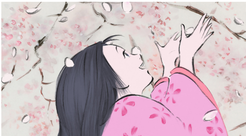
Die Legende der Prinzessin Kaguya © 2013 Isao Takahata, Riko Sakaguchi / Studio Ghibli, NDHDMTK