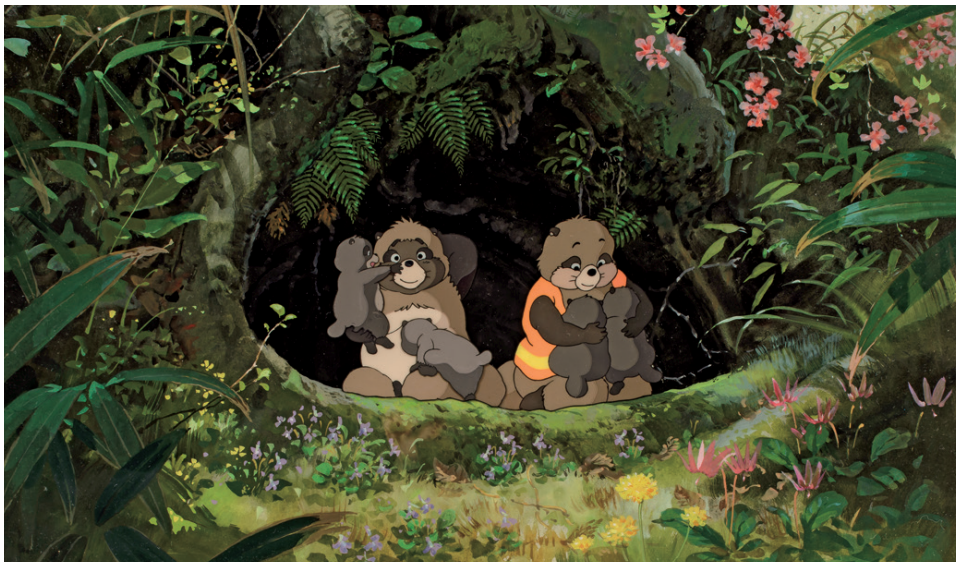
Pom Poko ©1994 Isao Takahata/Studio Ghibli, NH