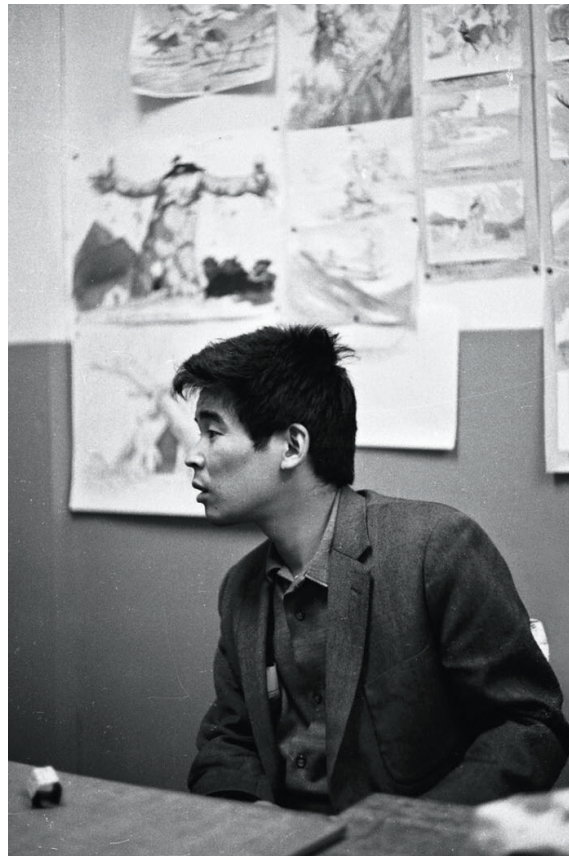
Porträt von Isao Takahata © Yasuo Otsuka