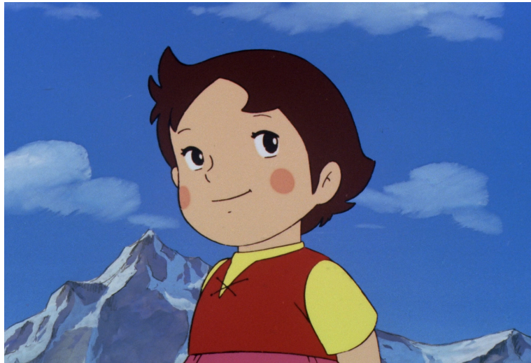
Heidi, 1974

Der bislang unveröffentlichte Ausstellungsbereich im mudac widmet sich dem entscheidenden Verhältnis von Isao Takahata zum Westen, insbesondere zum frankophonen Kulturraum. Er zeichnet seine Entdeckung des poetischen Realismus von Prévert nach, der zu einer Quelle seines ästhetischen wie auch politischen Engagements wurde. Zudem werden seine vertieften Forschungen zu La Bergère et le Ramoneur (1953) vorgestellt, anhand von Originaldokumenten, die die Entstehung seiner Berufung zum Animationsfilmer beleuchten.