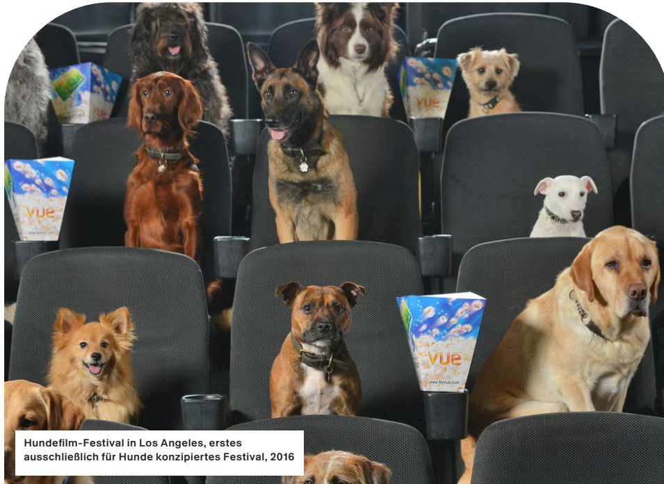
Hundefilm-Festival in Los Angeles, erstes ausschließlich für Hunde konzipiertes Festival, 2016

Für seine zweite Ausstellung im neuen Ausstellungsraum Le Carré taucht das mudac in die Welt von DOGTV ein und regt zu neuen Überlegungen über den Wandel der Beziehungen zwischen den Arten im Zeitalter der Haushaltstechnologie an.