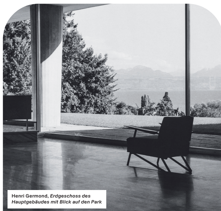
Henri Germond, Erdgeschoss des Hauptgebäudes mit Blick auf den Park