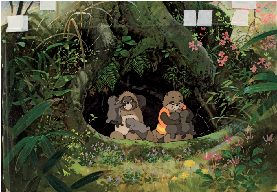
Pompoko, 1994 ©1994 Isao Takahata/Studio Ghibli, NH

Isao Takahata (1935–2018) zählt zu den grossen Meistern der Animationskunst. Als Mitbegründer des Studio Ghibli zusammen mit Hayao Miyazaki im Jahr 1985 schuf er seit den 1960er Jahren ein anspruchsvolles, poetisches und innovatives Werk. Mit seinem zutiefst humanistischen Blick, seinem Sinn für Erzählung und seiner formalen Kühnheit hat Takahata die Sprache des Zeichentrickfilms erneuert, ihn von seinen traditionellen Codes befreit und zu einer eigenständigen Kunstform gemacht – erkennbar an dem, was er selbst als „Erfindung der animierten Realität“ bezeichnete.