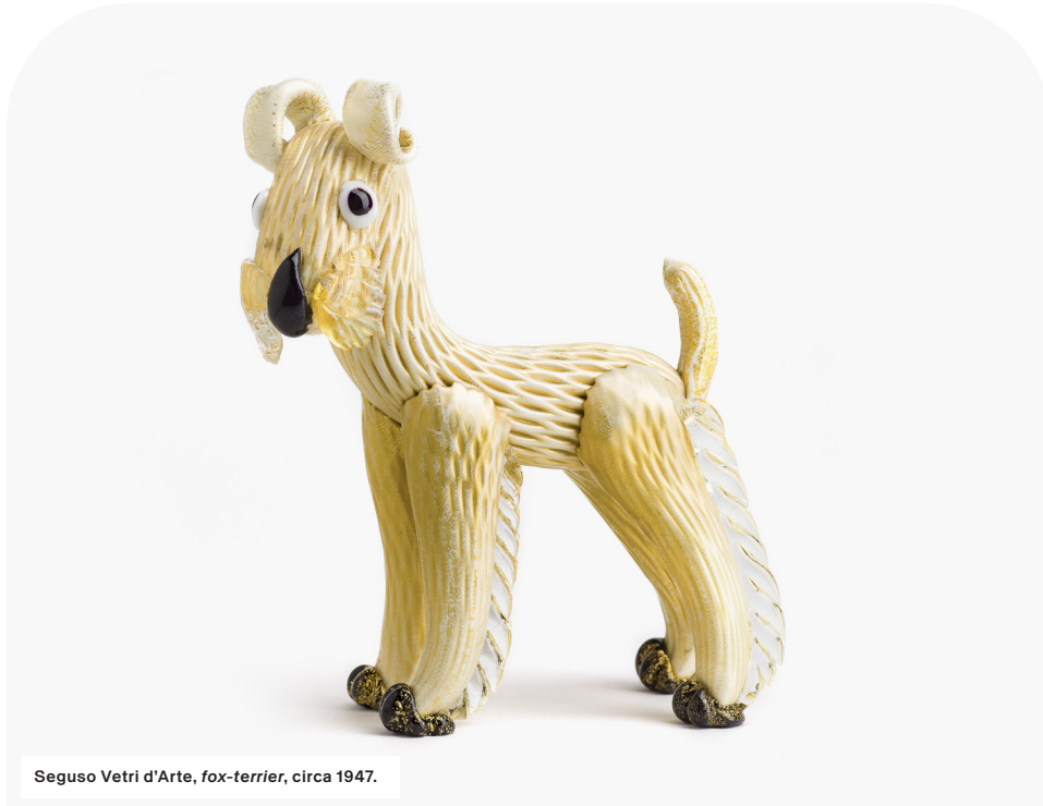
Seguso Vetri d'Arte, fox-terrier, circa 1947.