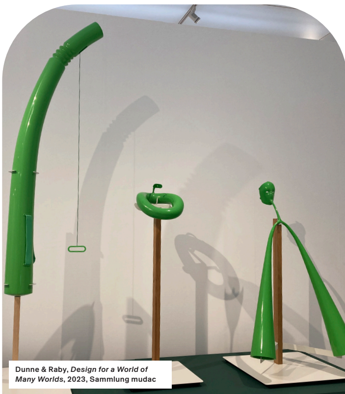
Dunne & Raby, Design for a World of Many Worlds , 2023, Sammlung mudac

Durch immersive Installationen, zeitgenössische Rituale und spekulative Werke lädt die Begegnungsentologie zu einer Erfahrung ein, bei der Design zu einem Werkzeug wird, um die Welt anders zu bewohnen – eine Welt, in der die Grenzen zwischen Rationalität und Faszination verschwimmen, in der Technologien mit dem Spirituellen in Dialog treten und in der jeder Besucher und jede Besucherin dazu aufgefordert wird, sich in einen Zauberer oder eine Zauberin zwischen mehreren Welten zu verwandeln.