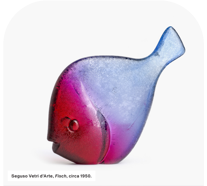
Seguso Vetri d'Arte, Fisch , circa 1950.