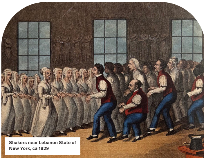
Shakers near Lebanon State of New York, ca 1829