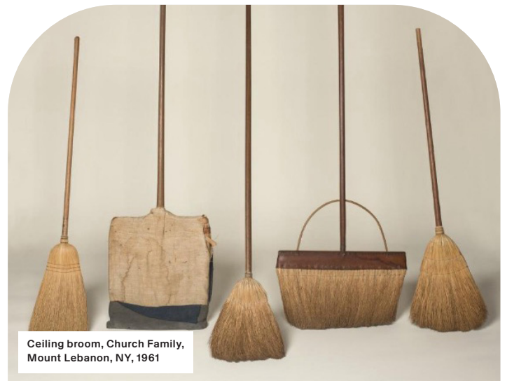
Ceiling broom, Church Family, Mount Lebanon, NY, 1961