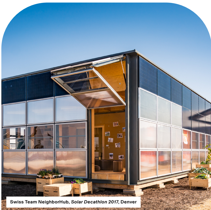
Swiss Team NeighborHub, Solar Decathlon 2017 , Denver