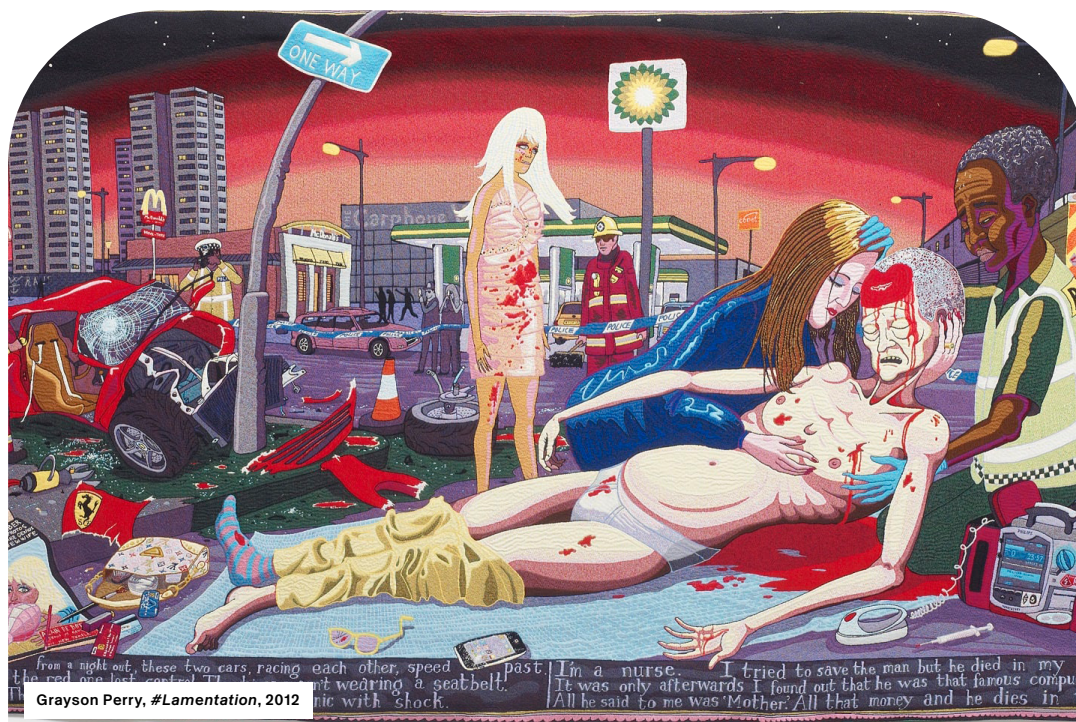
© Grayson Perry Courtesy the artist and Victoria Miro

Le mudac et la Fondation Toms Pauli présentent une exposition exceptionnelle consacrée à la tapisserie comme vecteur de discours sociaux et politiques. Loin d'être cantonnée à un rôle d'ornementation, la tapisserie a toujours été un puissant outil de narration et de témoignage. De l'époque médiévale aux créations contemporaines, elle incarne un espace de dialogue entre les aspirations collectives, les récits historiques et les enjeux contemporains. L'exposition réunit des œuvres majeures de la collection Toms, tissées dans les prestigieux ateliers de Bruxelles entre 1660 et 1725, et des créations contemporaines signées par Goshka Macuga et Grayson Perry, deux artistes récompensés par un prestigieux Turner Prize. Les tentures, telles que l'Histoire de Scipion l'Africain ou des Empereurs Titus et Vespasien, mettent en scène des épisodes glorieux et symboliques des récits romains. A cette occasion, deux tapisseries seront présentées pour la première fois au public, témoignant de la valeur et du prestige de cette collection, propriété de l'Etat de Vaud.