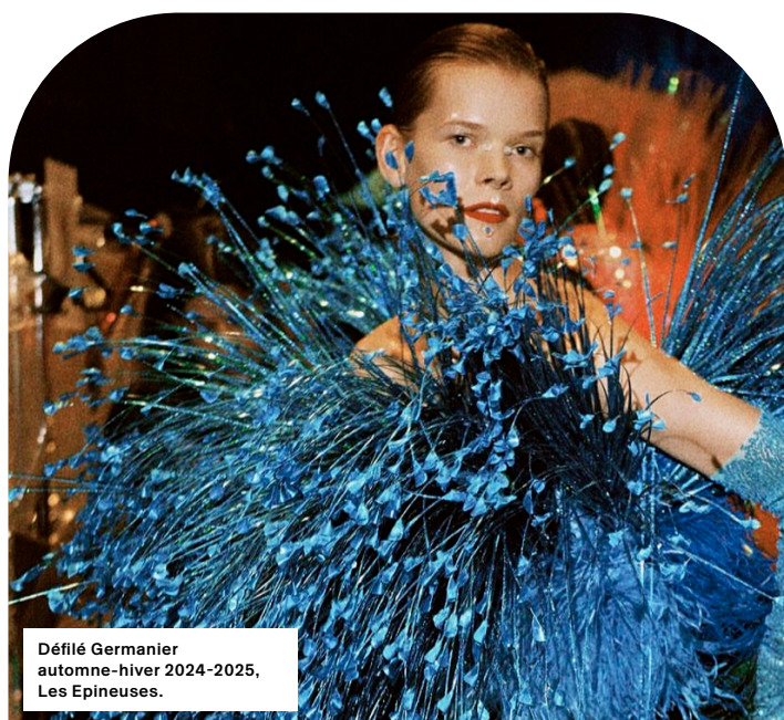
Défilé Germanier automne-hiver 2024-2025, Les Epineuses.