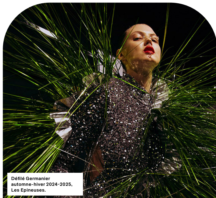
Défilé Germanier automne-hiver 2024-2025, Les Epineuses.