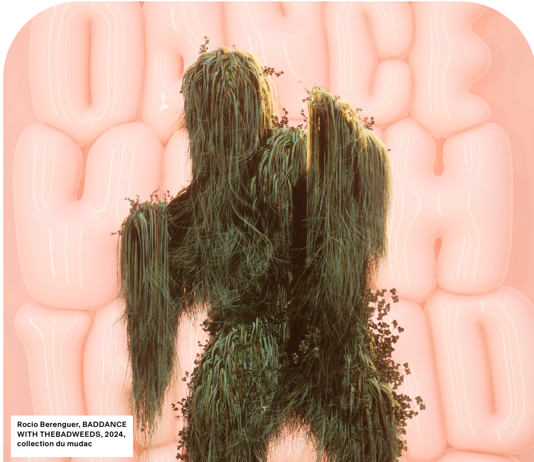
Rocio Berenguer, BADDANCE WITH THEBADWEEDS, 2024, collection du mudac