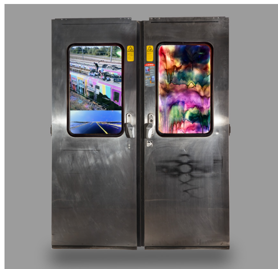
Maxime Drouet, Brume 25072021 , 2021 Portes de wagon avec vidéo et peinture éclairée, 195 × 150 × 10 cm Montreuil, Studio de l'artiste © Maxime Drouet