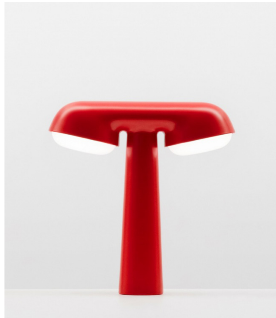
Ionna Vautrin, Lampe TGV (coédition entre la marque Moustache et la SNCF), 2017. Aluminium, polycarbonate, 27,5 × 28,5 × 9 cm.