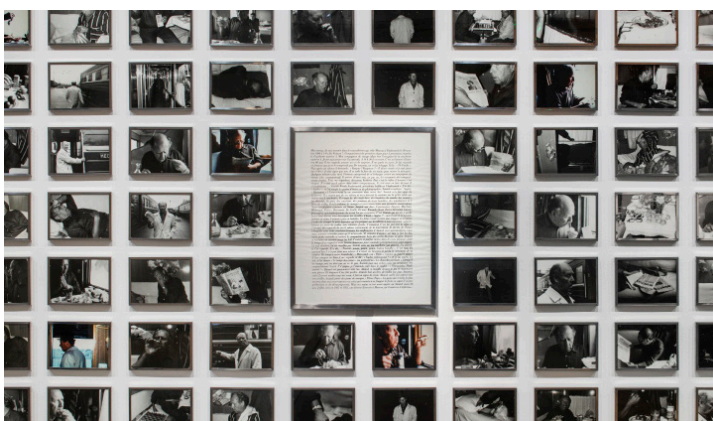
Sophie Calle, Anatoli (détail) , 1984 Photographies couleurs, photographies noir et blanc, texte, 266 × 905 cm (18 × 23 cm chaque photographie) Collection FRAC Centre-Val de Loire, Orléans © Martin Argyroglo Courtesy FRAC Centre-Val de Loire © 2022, ProLitteris, Zurich