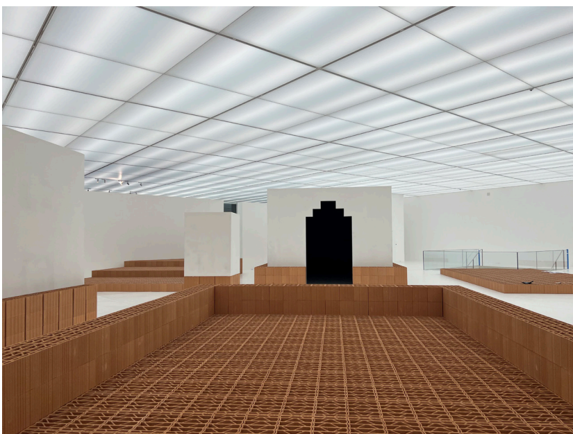
Aperçu du montage de la scénographie de l'exposition Rencontrons-nous à la gare .