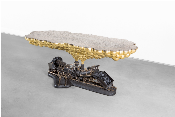
Studio Job, Train Crash Table , 2015 Bronze poli et patiné, 75 × 200 × 90 cm Paris, Carpenters Workshop Gallery