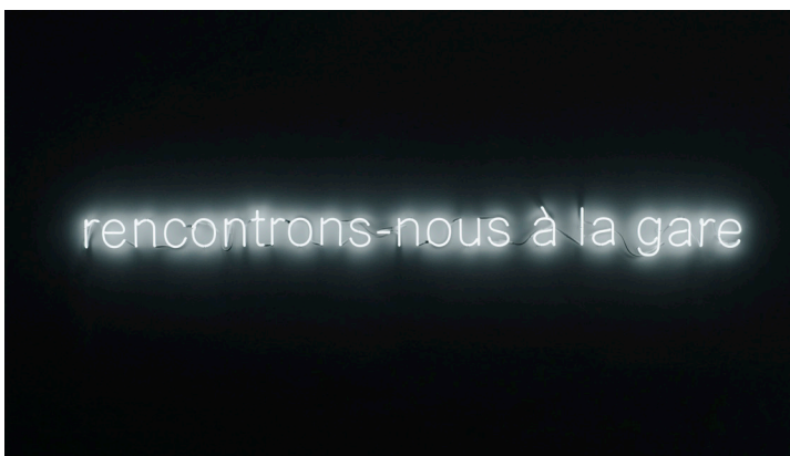
Namhee Kwon, Rencontrons-nous à la gare , 2020. Tubes néons blancs, L 2,65 m x H lettres 11,7 cm, tube en 11mm.