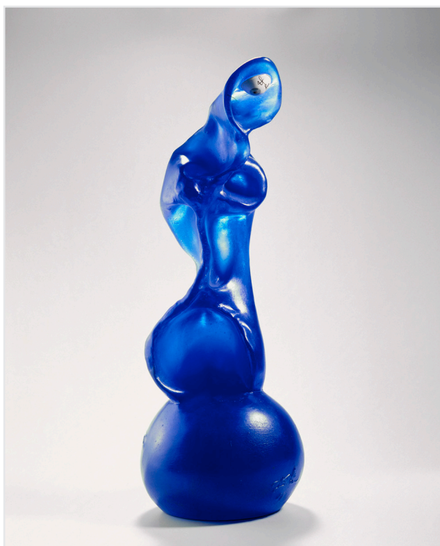
Salvador Dalí, Cyclope , 1968

Grâce à ce mécénat exceptionnel, cette collection unique est aujourd'hui riche de plus de 700 œuvres d'artistes, créateurs.trices verriers ou designers internationaux qui illustrent l'histoire de l'art verrier contemporain des années 1950 à nos jours. Des ensembles marquants s'y distinguent dont les œuvres issues de la Fucina degli Angeli - atelier du maître verrier vénitien Egidio Costantini ayant collaboré avec d'importants artistes du 20ème siècle - et celles du mouvement Studio Glass tel qu'il se manifeste en Europe, au Japon et aux Etats-Unis. Depuis quelques années, de nombreuses