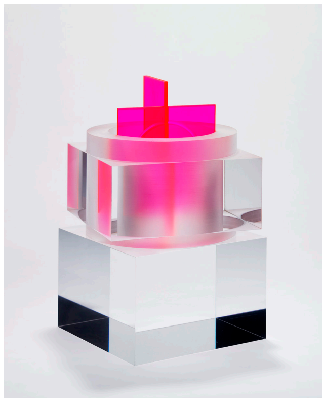
Maurice Ruche, Cube architecture , 1975