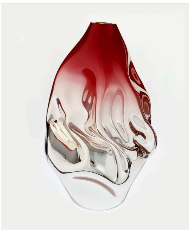
Jeff Zimmerman, Unique Crumpled sculptural vessel in silver mirrored hand-blown glass with red top , 2014

Après de longues années à enrichir la collection, Peter Engelhorn décède mais sa femme Traudl continue à assister – jusqu'à l'année passée – aux séances d'acquisitions du musée en amenant son regard sur les sélections des œuvres à acquérir.