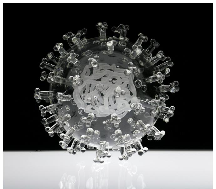
COVID-19, Luke Jerram, 2020, Verre borosilicate Collection mudac © Luke Jerram