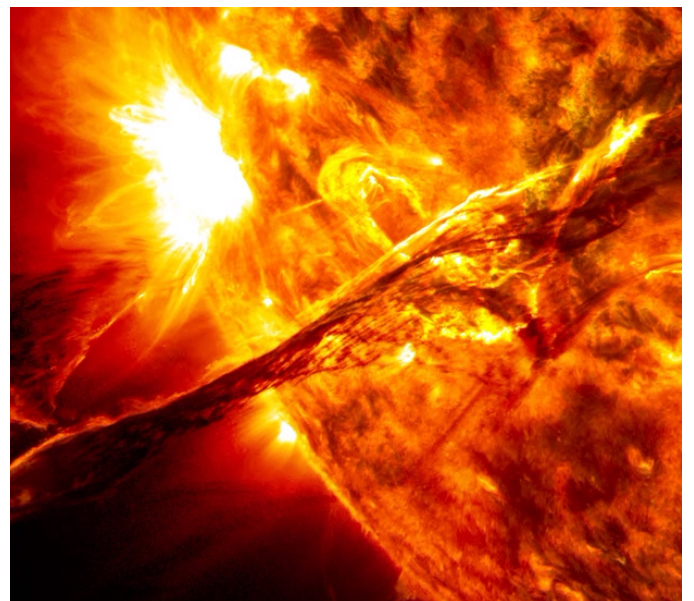
Sun 1, National Journal, NASA, 2014