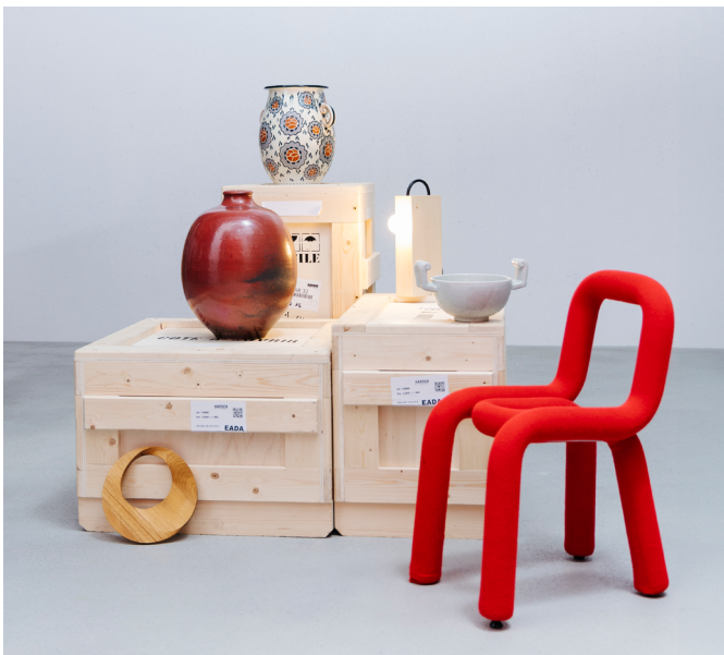
Extrait collection du mudac

La Solar Biennale émerge dans un pays différent tous les deux ans. Elle implique à la fois professionnel·le·s et citoyen·ne·s et s'intéresse à la capacité du design à participer à la transition vers un avenir solaire. En 2025, de l'équinoxe de printemps à l'équinoxe d'automne, le mudac accueillera la biennale pour sa deuxième édition, invitant également des partenaires tels que l'EPFL dans son programme. Baignée dans la création, éclairée par les enjeux contemporains, la Solar Biennale déploie le tapis jaune aux designers, curateur·trice·s, activistes, fournisseur·se·s d'énergie et chercheur·se·s qui, de manière pratique, esthétique ou théorique, détrônent les astres établis et montrent qu'un autre soleil est possible.