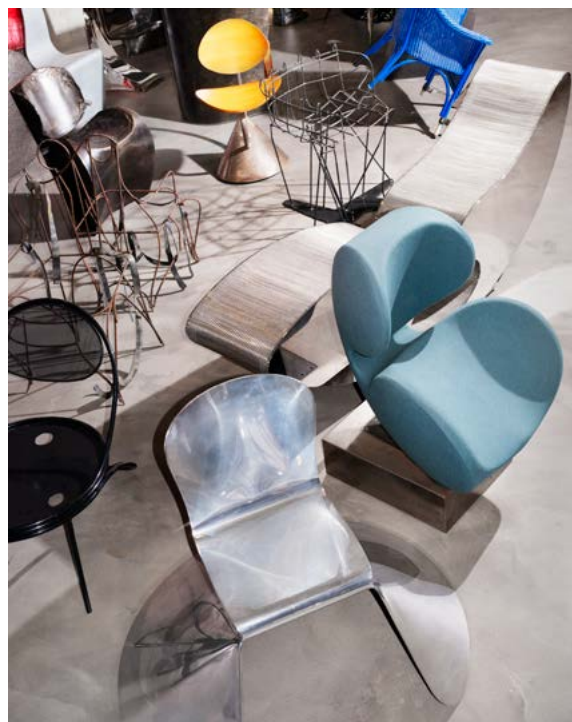
Vues de la Collection Thierry Barbier-Mueller

Située aux frontières de l'art et de la sculpture, la chaise incarne une tension d'esthétique et d'usage, une musicalité dont la gamme des possibles est infinie. Les acquisitions de Thierry Barbier-Mueller s'étoffent de manière spontanée au fil des découvertes et des rencontres jusqu'à devenir une collection à part entière réunissant plus de 650 chaises des années 1960 à aujourd'hui. Constituée d'environ deux tiers de pièces uniques, de prototypes ou d'œuvres issues d'éditions limitées, la collection reflète cet intérêt pour des objets atypiques, en dehors des créneaux habituels du design industriel. Loin de l'idée de réunir un corpus scientifique et exhaustif sur l'histoire contemporaine de la chaise, Thierry Barbier-Mueller s'intéresse à tout ce qui émerge de singulier et de nouveau dans ce domaine. Cet ensemble réunit la production de designers de renommée internationale, mais également de jeunes designers peu connu-e-s, de toutes nationalités confondues.