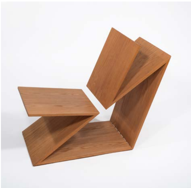
Robin Bara, Geoflux 101, 2007 Bois, Édition inconnue, numéro 8, 73 x 50 x 88 cm Collection Thierry Barbier-Mueller

Des îlots composés d'un réseau dense des chaises les plus colorées et les plus éclectiques de la collection donnent l'illusion au visiteur-euse de se perdre dans une forêt touffue. Couleurs vives, matières étonnantes et courbes prédominent dans un espace baigné de lumière. Les chaises ont été intuitivement regroupées par famille et regroupées autour de thèmes tels que l'animalité, la dualité, l'aspect sculptural, le côté pop et humoristique ou encore l'ingénierie.